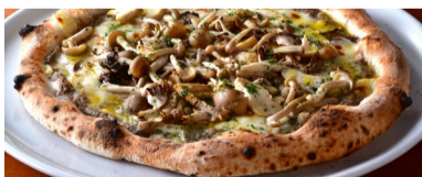
県産3種キノコとたっぷりチーズピッツァ