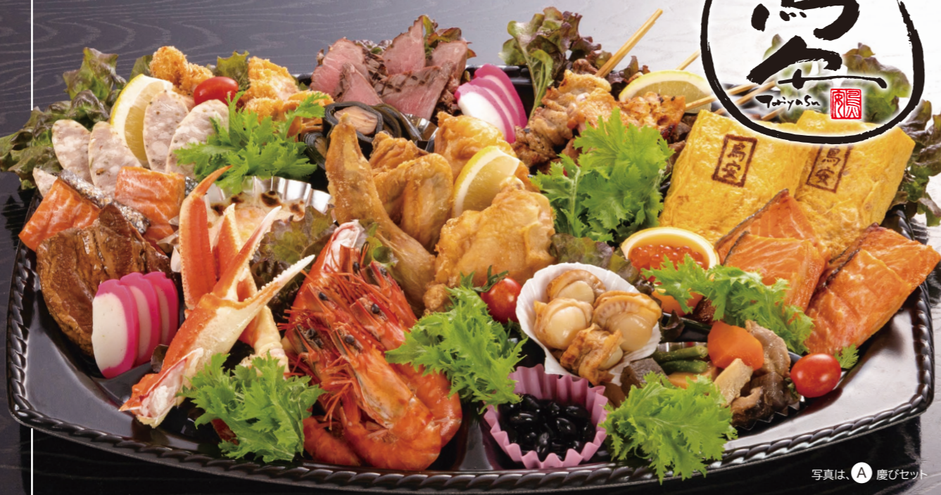
写真は、A 慶びセット

※オードブルは前日までにご注文ください ※仕入れ状況により内容産地等が変更になる場合があります