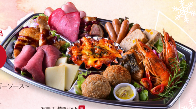
写真は、特選セットE