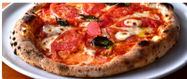
豊栄産桃太郎トマトのピッツァマルゲリータ

エビやホタテ、イカなど大きな魚類がたっぷり入ったトマトベースのピッツァ プレミアム シーフード 2,100円(税別)