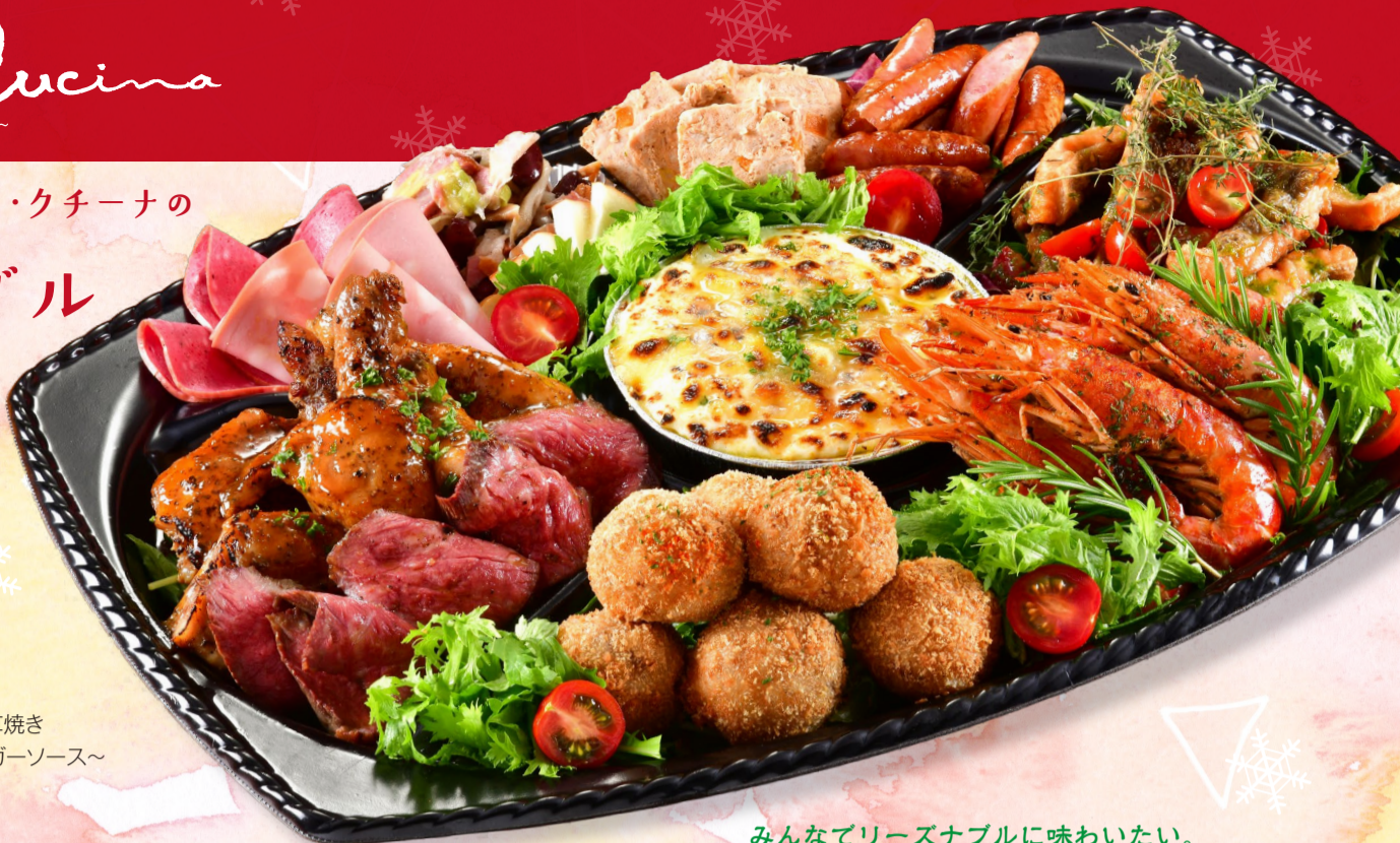
写真は、特選セットA