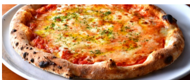
クアトロ・フォルマッジ(4種のチーズ)ピッツァ