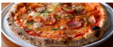
モルタデッラ(イタリアハム)とサラミのピッツァ